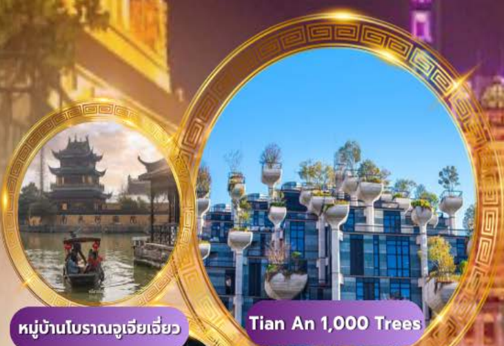
หมู่บ้านโบราณจูเจียเจี้ยว

บินหรู Full service พัก 5 ดาวย่านช้อปปิ้ง