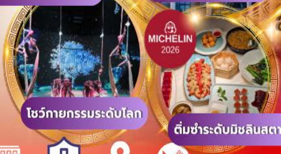
โชว์กายกรรมระดับโลก