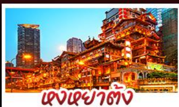
แดงเข่าตั่ง