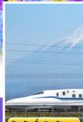
สัมพัสนั่งชินคันเซน