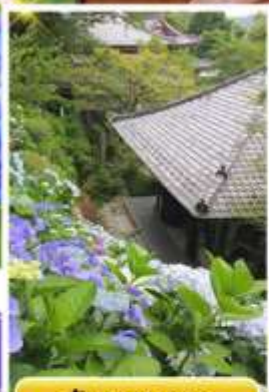
วัดฮาเซเดระ