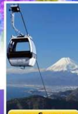
อิซุพานรามาวิว