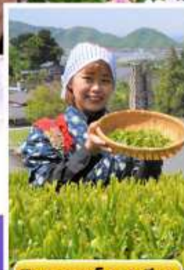
กิจกรรมเก็บชาเขียว