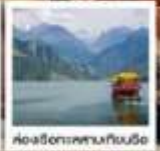
เมืองโบราณเฉียนชาน