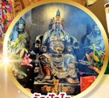
วัดปึกโต

เสริมโชคลาภนำความรุ่งเรือง ทุกด้านของชีวิต