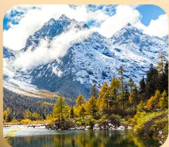
“ปี้ผิงโกว”

ชมธรรมชาติ 2 อุทยานขึ้นชื่อ อุทยานภูเขาสี่ครุณี + อุทยานปี้ผิงโกว สะพานหนานเฉียว • ถนนคนเดินไท่กู่หลี่ + ซุนซีลู่ + Pop Mart • ตงเจียวจี้