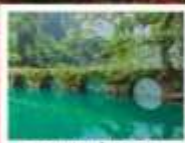
อุทยานเสี่ยวซีโขง