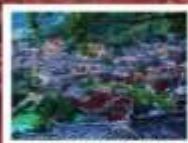
หมู่บ้านแม่วชิเจียง