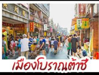
เมืองโบราณต้าซี