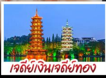
เจดีย์เงินเจดีย์ทอง