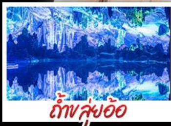
ถ้ำหลุ่ม้อ