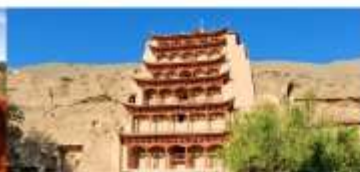
ถ้าแกะสลักม่อเกาคุ