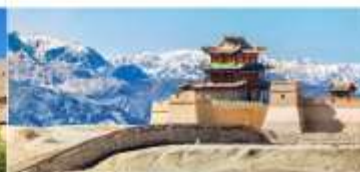
กำแพงเมืองจีน ด่านเจียอวี๋กวน

*ทางบริษัทฯ ขอสงวนสิทธิ์ในการสลับโปรแกรมทัวร์ตามความเหมาะสมขึ้นอยู่กับสถานการณ์หน้างาน โดยคำนึงถึงผลประโยชน์ของลูกค้าเป็นสำคัญ