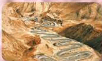
ถนนโบราณผืนหลงกู่ต้า