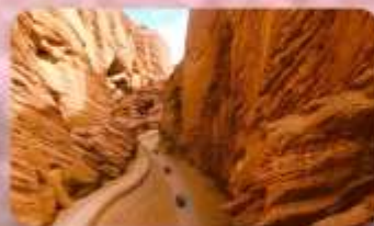
แกรนด์แคนยอนอาวูซือ