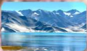
ทะเลสาบไป่ซาหู