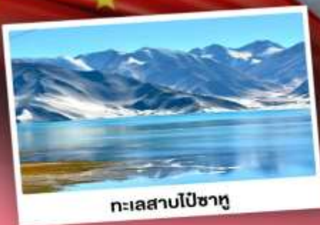
ทะเลสาบไปซาทุ

เปิดประตูสู่อารยธรรมพันปีแห่งซินเจียงใต้ ชมความสวยงามของหมู่บ้านดอกแอปเปิล