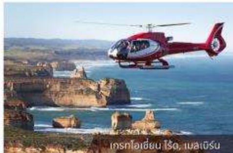
เฮลิคอปเตอร์, เมลเบิร์น