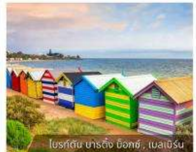
โบสถ์ดิน ชาติถึง ด็อกซ์, เมลเบิร์น