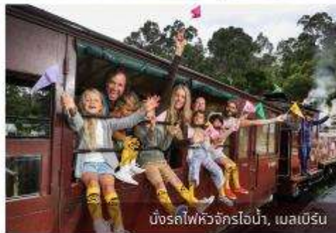
นั่งรถไฟหัวจักรไอน้ำ, เมลเบิร์น