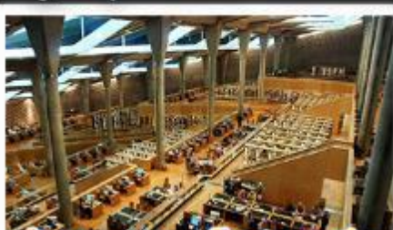
เขื่อนสิมุดอเล็กซานเดรีย