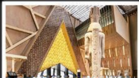
พิพิธภัณฑ์แกรนด์อียิปต์(GEM)

อารยธรรมลุ่มแม่น้ำไนล์ - พีระมิด - อเล็กซานเดรีย - เมมฟิส - ไคโร - โรงแรมระดับ 4 ดาว รวมค่าวีซ่า ทัศนะทะเลทราย - อาหารครบทุกมื้อ