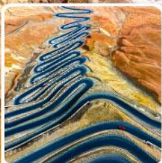
ถนนผานหลงกู่ต้าอว