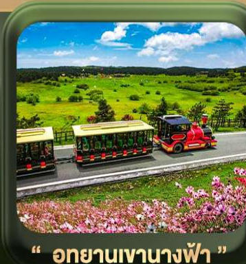
“ อุทยานเขานางฟ้า ”

T2G-CKG26CZ Special of Chongqing... วงซิ่ง ต้าจู้ อุ้หลง อุทยานหลุมฟ้า เขานางฟ้า 5D 3N (CZ)