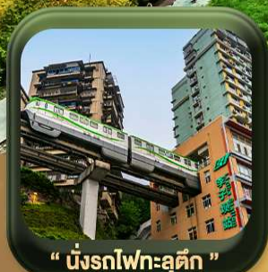
“ นั้รทไฟทะลุดัก ”

บินตรงลงวงซิ่ง • อุ้หลง หลุมฟ้าสะพานสวรรค์ • ระเบียงแก๊ว • อุทยานเขานางฟ้า หงหยาดัง • นั้รทไฟทะลุดัก • ศาลาประชาคม (ด้านนอก) • หลงหมินฮ่าว มรดกโลกพาหินแคะสลักต้าจู้ • วัดหลัวอัน • ตักตะเกียบ • ถนนคนเดินเจียฟ้างเป็ย