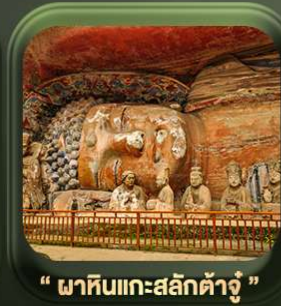
“ พาหินแคะสลักต้าจู้ ”