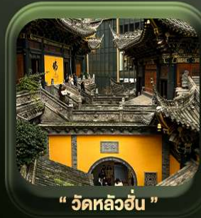
“ วัดหลัวอัน ”