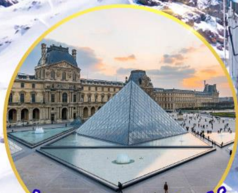
ถ่ายรูปคู่พีพีร์กันที่ลูฟร์