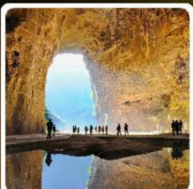
ถ้ำถึงหลง