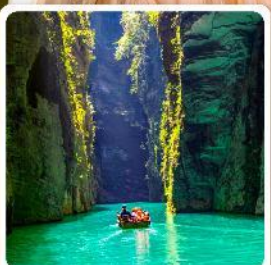
ผิงซานแกรนด์แคนยอน