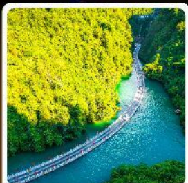
คุบเขาสิงโต

โไฮเก้! ปินตรงลงเอ็นซือ เกี่ยวเอ็นซือเน้นๆจัดเต็มทั่วเมือง คุบเขาสิงโต ผิงซานแกรนด์แคนยอน อุกยานจิ้นลี่ซาน