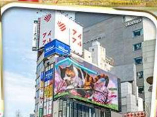
ตามรอยซีรีส์ชื่อดัง CAN THIS LOVE BE TRANSLATED?