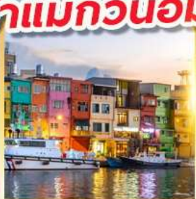
ท่าเรือประมงเจิ้งปิ่น