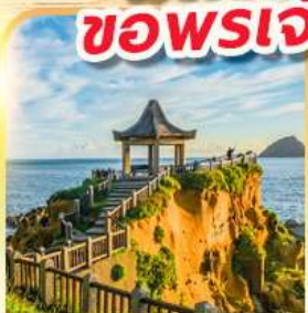
เกาะเหอผิง

พักย่านซีเหมินติง 2 คืน ขอพรเจ้าแม่กวนอิมพันมือ