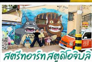
สตรีทอาร์ต สตูดิโอจิบลิ