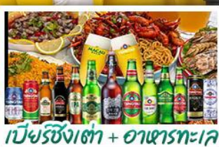
เบียร์ชิงเต่า + อาหารทะเล