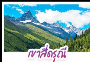
เขาสี่ดรุณี