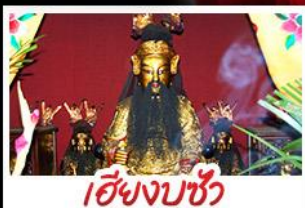
เอียงบูชิว