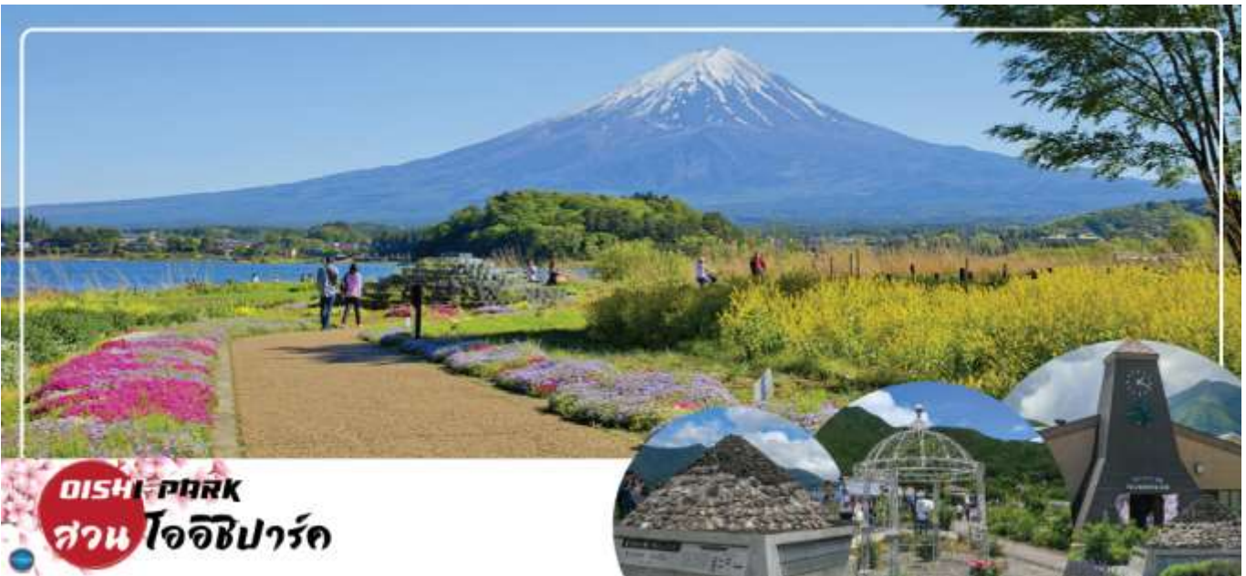
OISHI PARK สวน โออิชิพาร์ค

วันที่สาม จังหวัดยามานาชิ – สวนสาธารณะโออิชิ – พิพิธภัณฑ์ญี่ปุ่น – โกเทมบะพรีเมียมเอาท์เล็ต – เมืองนาริตะ – อีออน มอลล์ นาริตะ