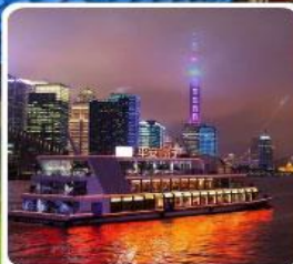
ล่องเรือแม่น้ำหวงผู่