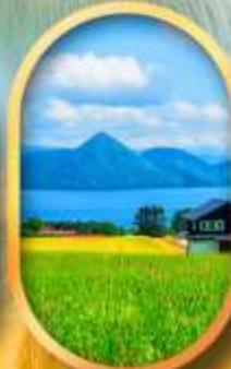
ทะเลสาบโทยะ