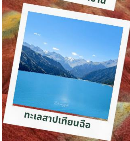
ทะเลสาปเทียนฉือ