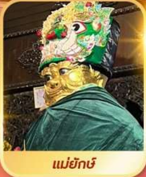
แม่ยักษ์