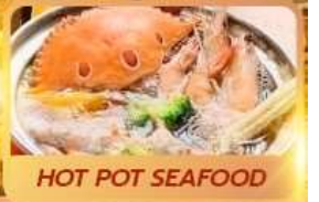
HOT POT SEAFOOD