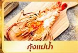
กุ้งแม่น้ำ