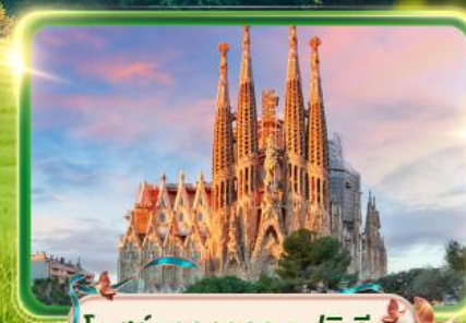
โบสถ์ซากราดา แฟมิลีย