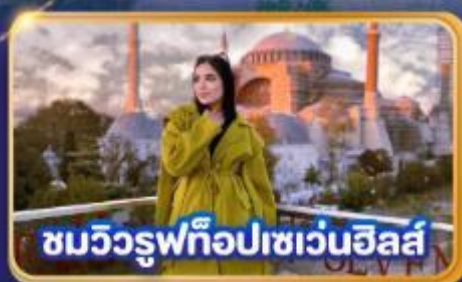
ชมวิวยุฟทือปเซเวนฮิลส์