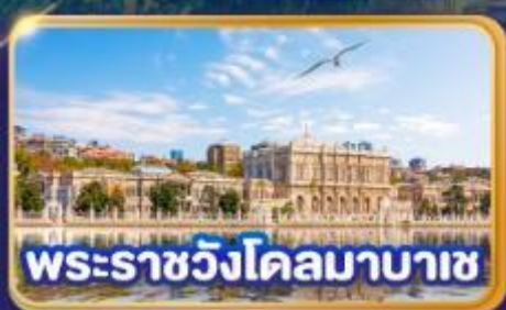
พระราชวังโดลมาบาเซ