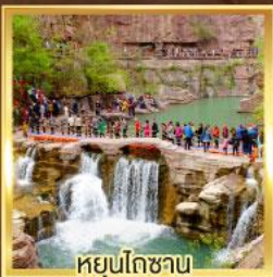
หยุ่นโกซาน