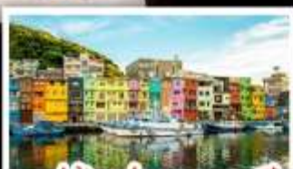
หมู่บ้านประมงหลากสี