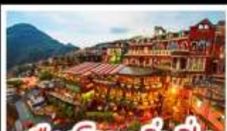
เมืองโบราณจิ่วเฟิ่น

ฟาร์มแกะซิงจิ้ง - ทะเลสาบสรียันจินตรา จิ่วเฟิ่น - หมู่บ้านประมงหลากสี - ไทเป 101 หมู่บ้านสายรุ้ง - ตลาดล่าหูก & ซีเหมินติง ปลาประ-ธานธิบดี - เขียวหลงเปา