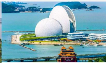
โรงละครไข่มุก