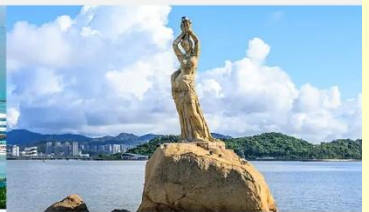
จูไห่ฟิชเชอร์เกิร์ล(หวีหนี่)

*ทางบริษัทฯ ขอสงวนสิทธิ์ในการสลับโปรแกรมทัวร์ตามความเหมาะสมขึ้นอยู่กับสถานการณ์หน้างาน โดยคำนึงถึงผลประโยชน์ของลูกค้าเป็นสำคัญ