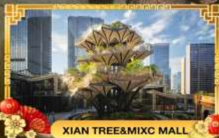
XIAN TREE&MIXC MALL

ซีอาน นครโบราณจีนชื่อง่เต้ | 4 วัน 3 คืน