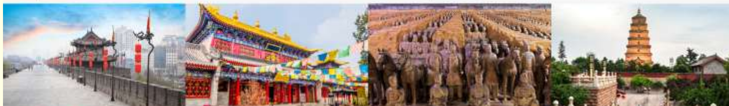
กำแพงเมืองโบราณ