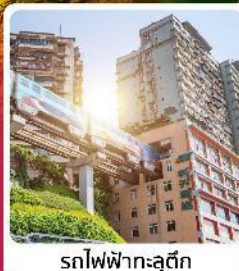
รถไฟฟ้าลูตึก