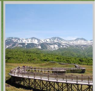
“SHIRETOKO 5 LAKES”