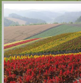
“SHIKISAI NO OKA”