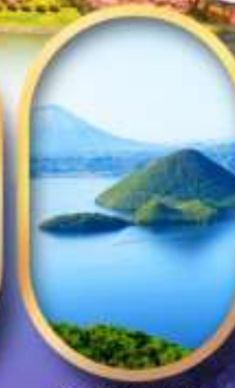
อิวะทะเลสาบโทโย