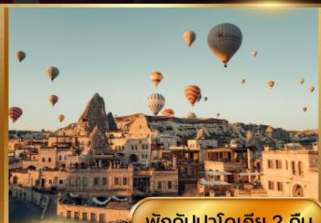
พิกคัมปาโดเกีย 2 คืน