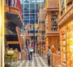
ร้านไอศกรีมมียาฮาร์