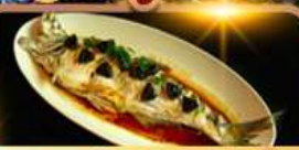
ปลาประรานาบดี