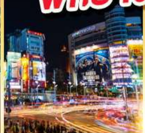
ย่านซีเหมินติง