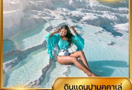
ดินแดนปามุคคาเล่