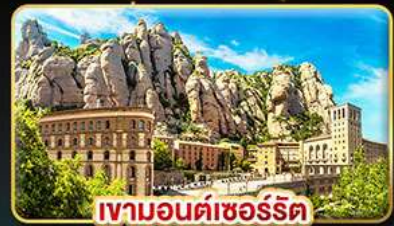
เขามอนต์ซอร์ริต