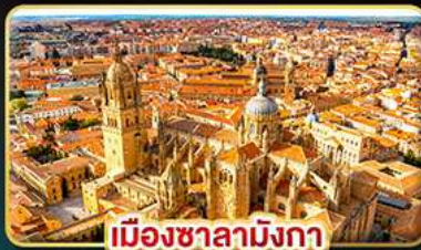
เมืองซาลามังกา