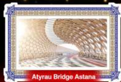
Atyrau Bridge Astana