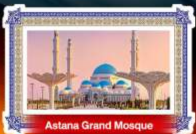
Astana Grand Mosque