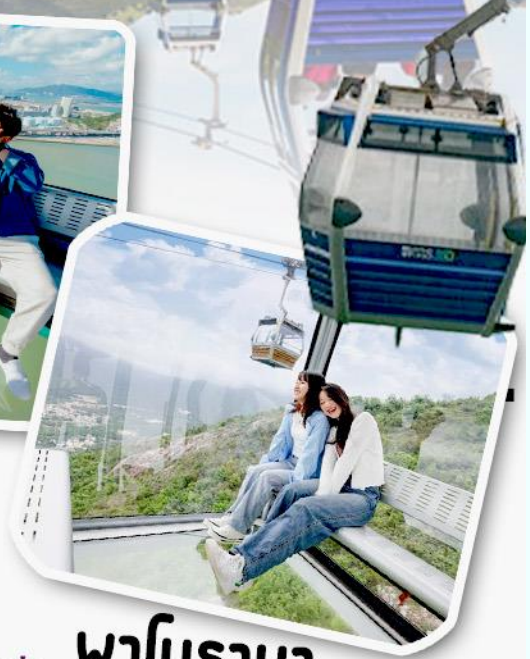
พานิราม่า