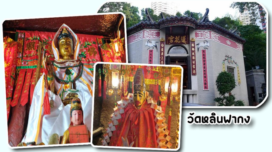
วัดหลินฟาง

นอกจากนี้ทางวัดหลินฟ้าก็ยังมี เทพเจ้าสาวจื่อเอี๊ยะ หรือเทพเจ้าสายนรก เป็นเทพเจ้าที่ขึ้นชื่อเรื่องกตัญญูที่มาในรูปแบบลักษณะการรุ่มง่อม ผ่าดิบ ซึ่งเป็นสัญลักษณ์ของการไว้ทุกข์ที่คนเชื้อสายจีนให้ความสำคัญ เทพเจ้าองค์นี้ก็เปี่ยมไปด้วยพลังหยิน ซึ่งเป็นด้านเกี่ยวกับเงินทองของ สำหรับผู้ที่ชอบเสี่ยงโชค