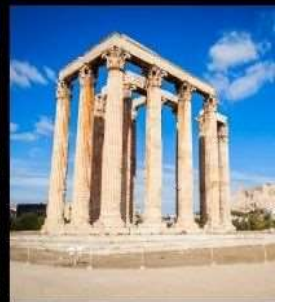
Temple Of Olympian