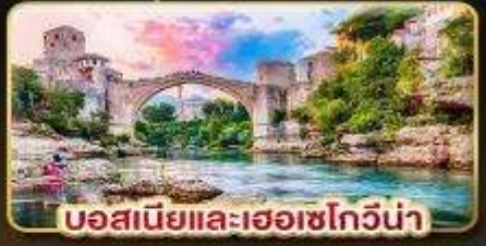
บอสเนียและเฮอซโกวีน่า