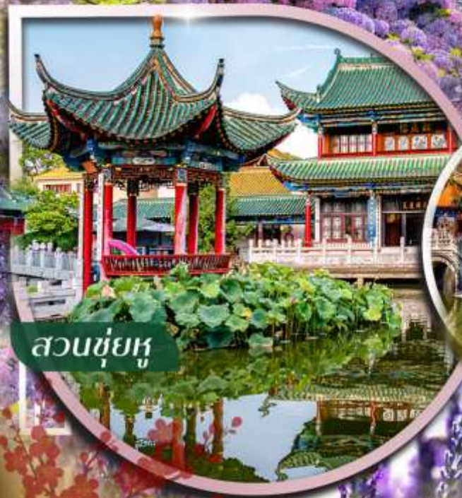
สวนชู่ยู่