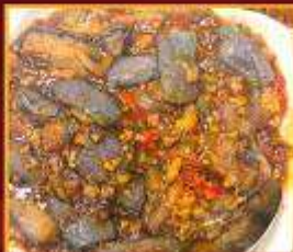
มะเขืออบหม้อดิน