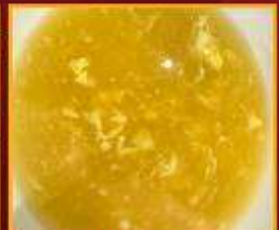
ซุ๊ปข้าวโพด