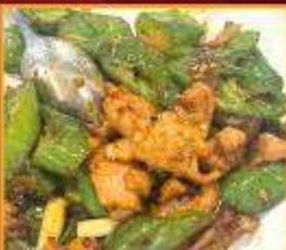
หมูผัดพริกหยวก