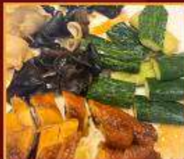
ไก่ แดงกวา เห็ดหูหนู