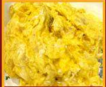
ไข่เจียวทรงเครื่อง