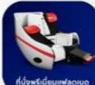
ที่นั่งพรีเมียมเฟลทเบด

บริการอาหารร้อน และ น้ำดื่ม บนเครื่อง ขาไป และ ขากลับ