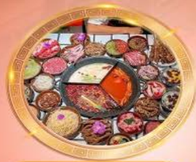
บุฟเฟต์หม้อไฟลงชิ่ง