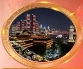
มือตำร้านอาหารอวโหล่งล้า