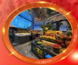
มือพิเศษ บุฟเฟต์นานาชาติ