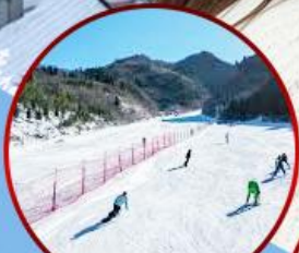
ลานสกีจินซาน