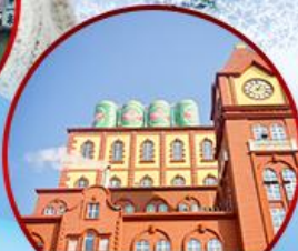
โรงงานเบียร์ซิงเต่า