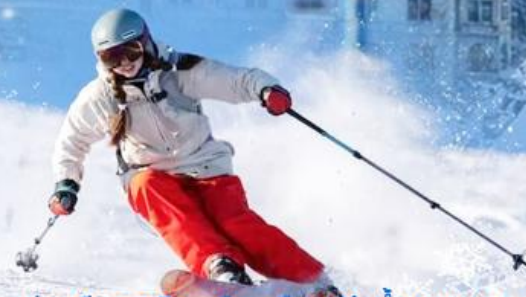
เล่นสกีทะเลยหิมะ เมืองแห่งน้ำพุ ชานตง