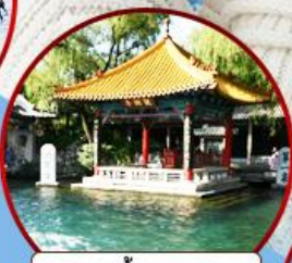
บ่อน้ำพุเปาหู