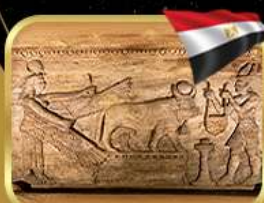
สุสานใต้ดินอเล็กซานเดรีย

เข้าชมพิพิธภัณฑ์อียิปต์แห่งใหม่ (GRAND EGYPTIAN MUSEUM)