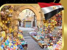
ตลาดชานเอลคาลิลี