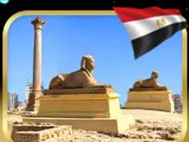
เสาสีมันปอมเปย์